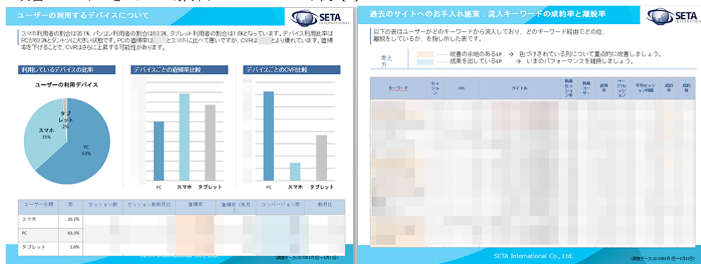
改善レポートつきアクセス解析サービス レポート例 [1]